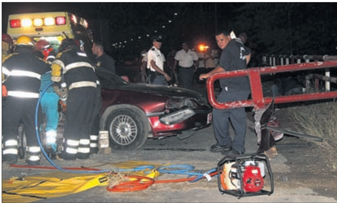
Foto di archivo di e accidente falta cu a tuma luga dia 9 di maart ultimo den oranan di anochi, caminda e auto a dal den vangrail cu a laga dos marinier morto.

Ta trata di e hoben di 23 aña di edad cu dia 9 di maart a haya su mes den un accidente ora cu e la bay desvia pa un otro auto,